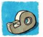
du scotch ou du ruban adhésif