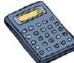
une calculette ou une calculatrice