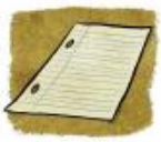
une feuille, une feuille de classeur