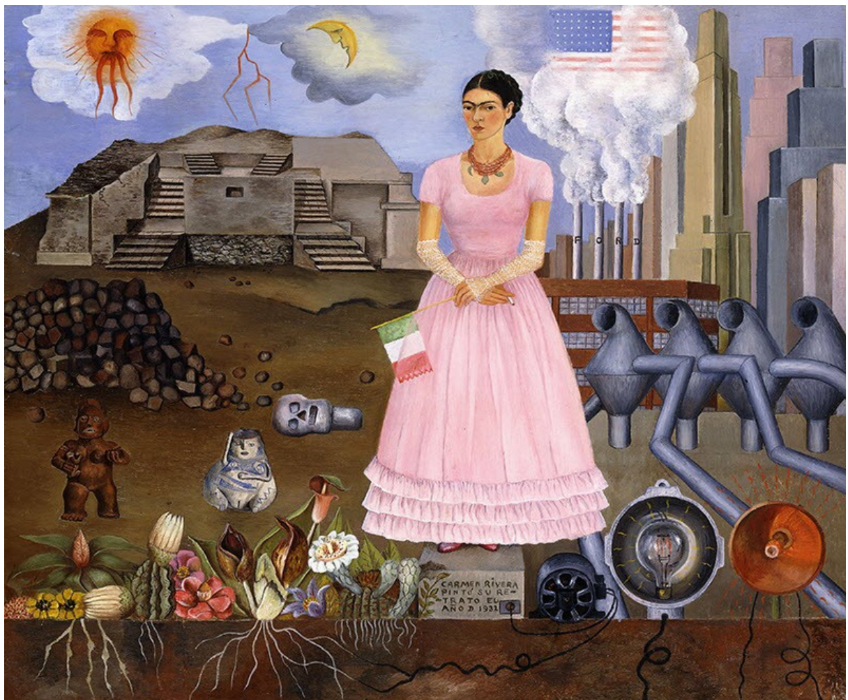
Autoportrait à la frontière entre le Mexique et les États-Unis, par Frida Kahlo, 1932.

En 1925, un accident de bus la laisse gravement blessée, notamment aux jambes et à la colonne vertébrale . Frida Kahlo doit rester de longs mois alitée et porter des corsets. Pour pallier ce manque d'activité, elle commence à peindre et sa mère lui installe un miroir au-dessus de son lit. C'est ainsi qu'elle commence à réaliser ses célèbres autoportraits , notamment l'"Autoportrait à la robe de velours", en 1926. En 1928, ayant recouvré presque toute sa mobilité, Frida Kahlo s'inscrit au Parti communiste. Cette même année, elle rencontre le peintre Diego Rivera et lui montre quelques-uns de ses tableaux. C'est le début d'une histoire d'amour tumultueuse .